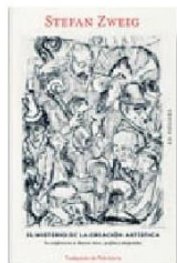
El Misterio de la Creación Artística Stefan Zweig / La Pollera

Los aviones vuelan rasantes sobre su casa y el niño quiere salir a mirar. "No salgas a la calle, ¡te va a caer una bomba!", grita su mamá cuando Pablo camina hacia la puerta. Entonces ocurre el estallido. La ventana explota en mil astillas y Pablo, de cuatro años, va a dar al suelo. Esa imagen de los Hawker Hunter cruzando el cielo y la bomba que cayó cerca de su casa se volvieron el recuerdo fundacional de su memoria. Muchos años después, convertido en un cronista en viaje, Pablo investiga este hecho que lo obsesiona y que apenas aparece, entre líneas, en los libros: durante el bombardeo a La Moneda y a la casa del Presidente Allende, uno de los pilotos apuntó contra el hospital de la Fach. ¿Error de un piloto novato o la acción de un desertor? Juan Pablo Meneses usa los recursos de la no ficción y los mecanismos de la ficción literaria para contar un relato cautivante.